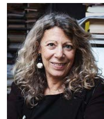
Barbara Cassin, médaille d'or 2018 du CNRS